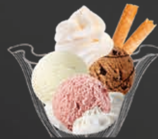
Coupe nach Wahl

mit Glace und Rahm CHF 13.00 nur Rahm CHF 9.00