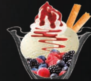
Coupe Hot Berry