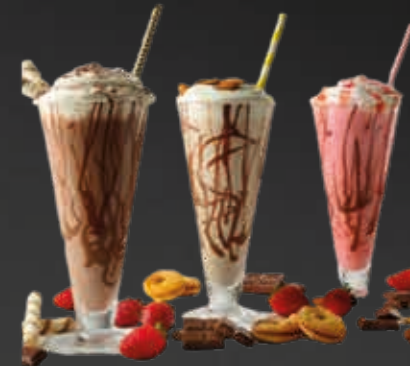
Frappés 9.00 CHF