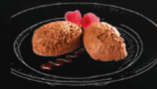
Mousse au Chocolat