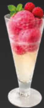
Himbeer mit Prosecco 14.00 CHF