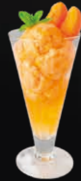
Aprikosensorbet mit Likör 14.00 CHF