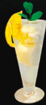
Le Colonel 14.00 CHF