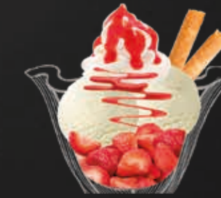
Coupe Romanoff (Saisonal)